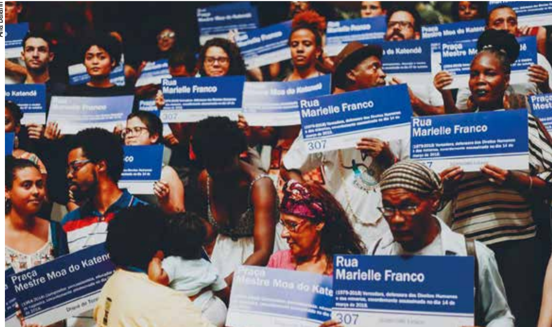
Homenagem a Marielle Franco, em ato em Volta Redonda, ano passado, do qual a Aduff participou