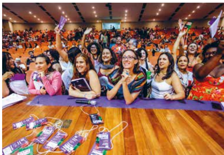
Comemoração: docentes de diferentes gerações comemoram

O debate foi marcado por momentos de emoção. Docentes de diferentes idades, seções sindicais e tempo de militância defenderam a resolução. Dificuldades na militância por conta do gênero foram citadas e a importância da decisão da política de paridade de gênero, ressaltada. Lembraram a presença de mulheres em lutas históricas da classe trabalhadora. Cantaram a canção “Maria, Maria” como um hino à resistência feminina e à luta das mulheres. Gritaram “Marielle, presente!”, e celebraram a aprovação da resolução com abraços e lágrimas.