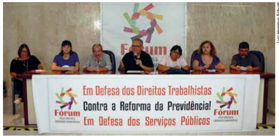
Delegação da Aduff contou com cinco docentes