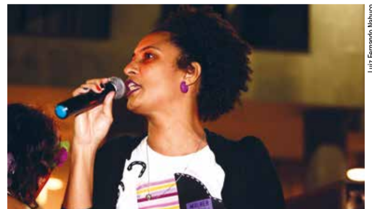
A vereadora e ativista Marielle Franco