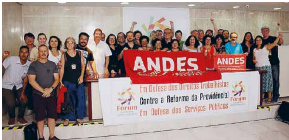
Docentes representando o Andes-SN e seções sindicais de várias partes do país participaram da reunião para construção do Fórum

Andes-SN e Aduff participam da construção do Fórum nacional que reúne movimentos sociais, sindicais, da juventude e organizações políticas para defender direitos e liberdades democráticas