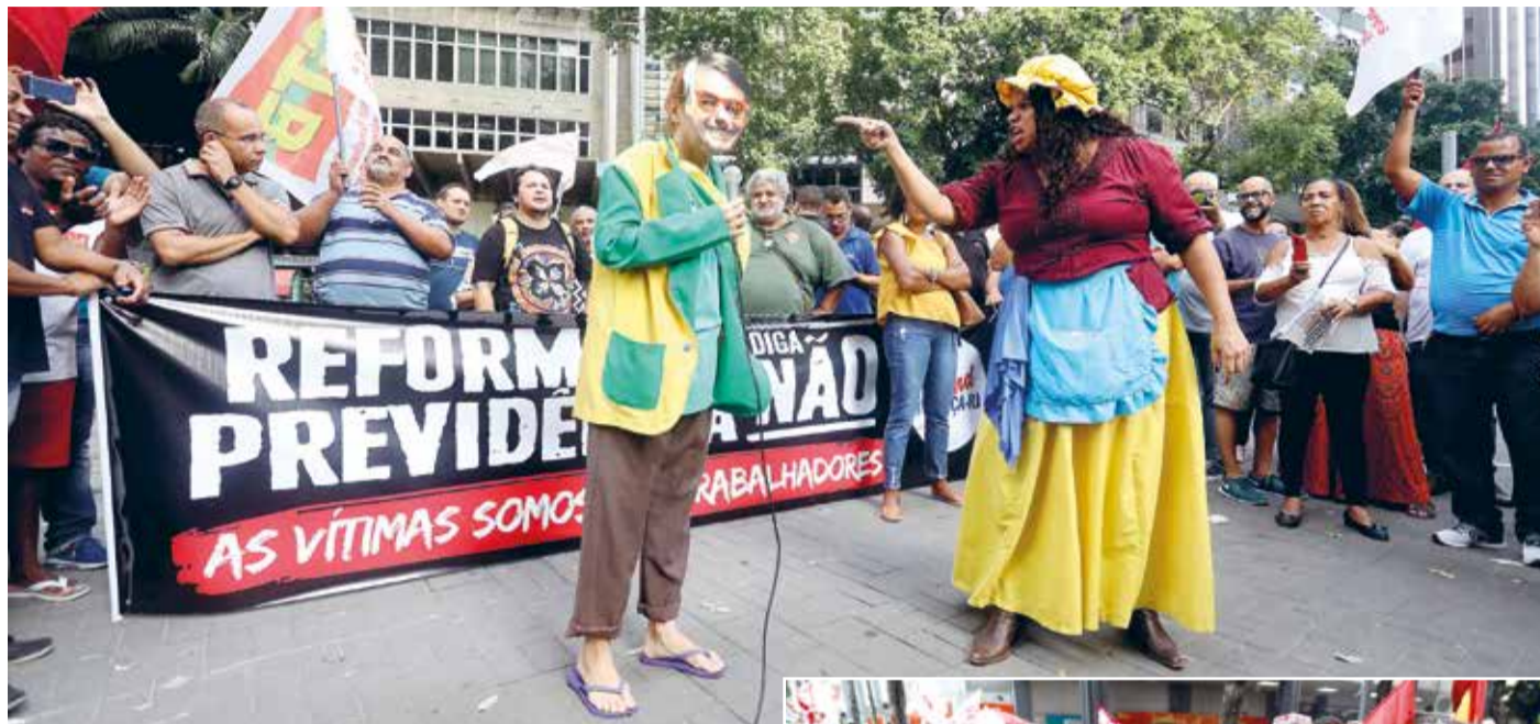
Ato no Rio, dia 20, na Carioca, teve teatro de rua

A PEC-6 traz perdas para toda a classe trabalhadora, disse, mas ainda maiores para as mulheres. “Quando me perguntam quem será mais prejudicado nessa reforma, que atinge a todos os trabalhadores, não tenho dúvidas de dizer que são as mulheres. E há hierarquia nisso: dentre as mulheres, a mulheres negras e as